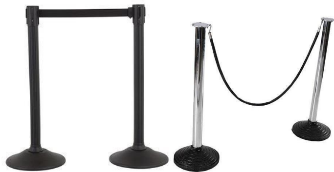
(Imágenes de referencia)